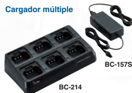
Cargador múltiple BC-214

* Tx: Rx: En espera = 5 : 5 : 90 Economizador activado