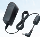
Adaptador CA BC-123SE