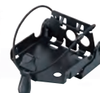
MB-130 Para uso con BC-213.

Icom, Icom Inc. y el logo de Icom son marcas registradas de Icom Incorporated (Japón) en los EEUU, RU, Alemania, Francia, España, Rusia, Japón y/u otros países.