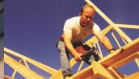
En la construcción