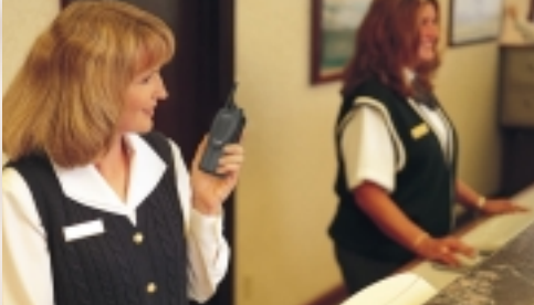
En restaurantes y hoteles