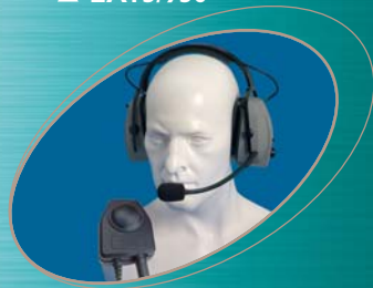
■ CHP750D ▲ CHP950D