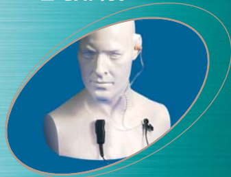
■ EA15/750 ▲ EA15/950