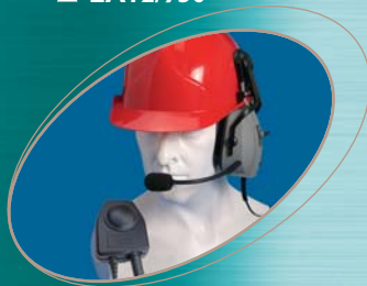
■ CHP750HS ▲ CHP950HS