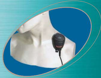
■ CMP750 ▲ CMP950