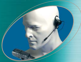
■ EA19/750 ▲ EA19/950