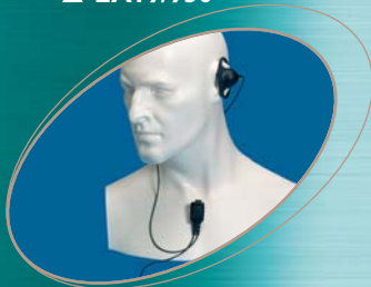
■ EA12/750 ▲ EA12/950